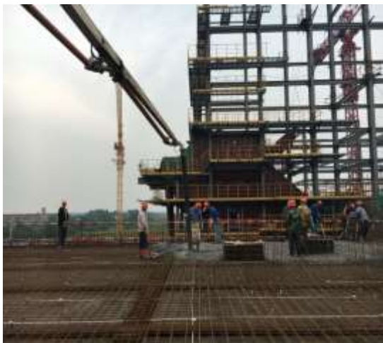
集控樓結構封頂完成