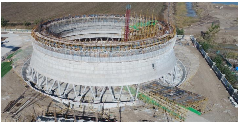
冷卻塔第十節澆築完成