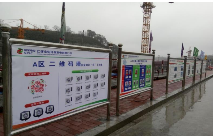
安全管理責任資訊牌推出“二維碼牆”