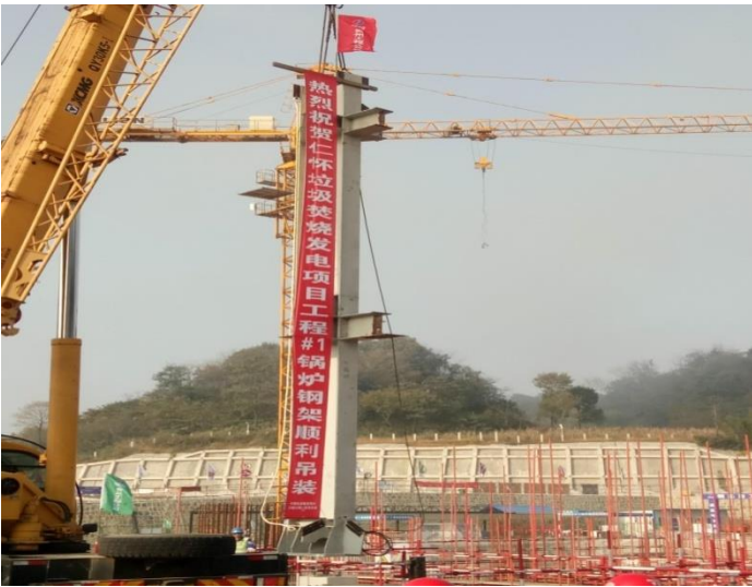
#1 鍋爐第一根鋼結構吊裝完成