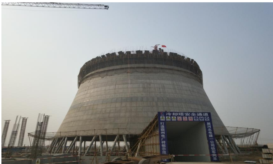
冷卻塔筒身 16 板澆築完成