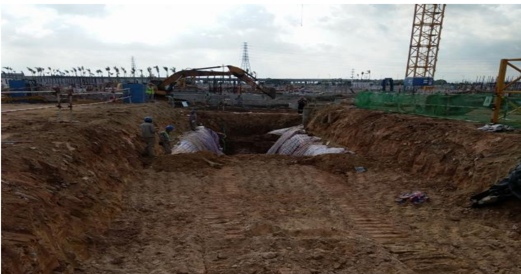
迴圈水管道開挖及邊坡防護