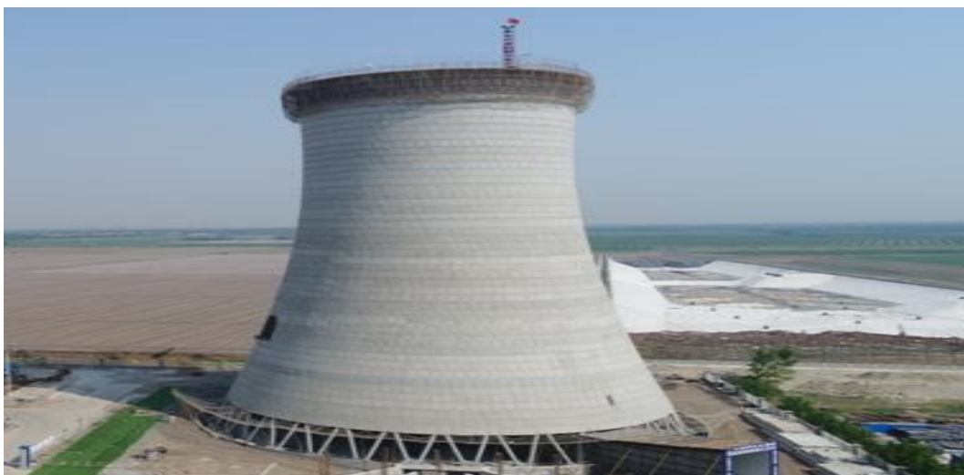
冷卻塔筒身到頂澆築完成