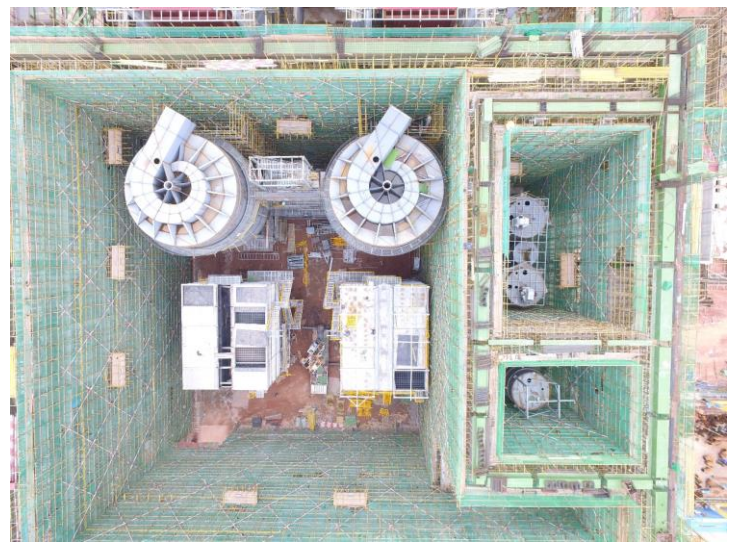
煙氣淨化間結構施工