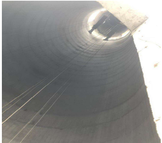
煙囪內筒平臺安裝