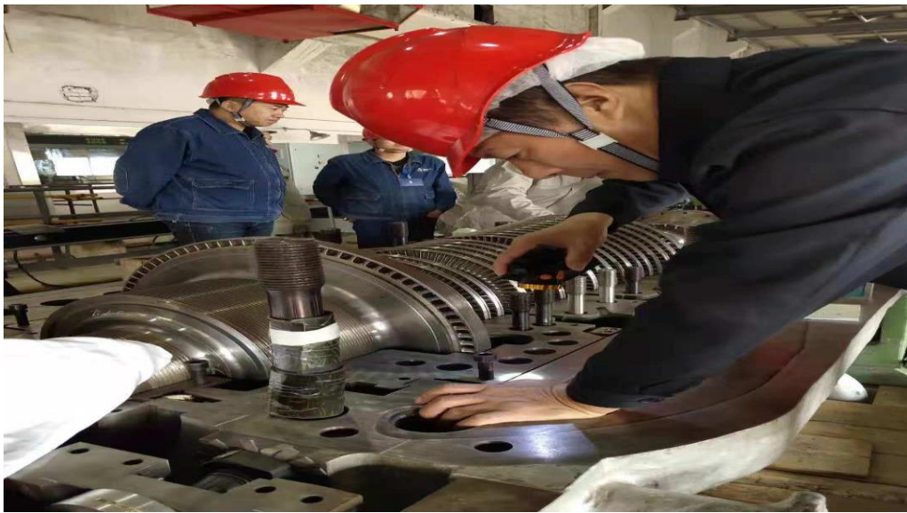
汽輪機扣缸前監檢